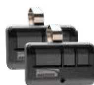
Control remoto MAX de 3 botones (893MAXLMK)